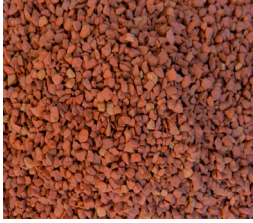
(A粒) 赤 (A1粒)